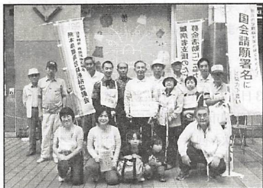
熊本県難病連の皆さん

熊本県では10月3日(土)11時から13時まで、熊本市下通りダイエー前にて行いました。12団体22名の参加で、署名201筆、募金10,246円でした。