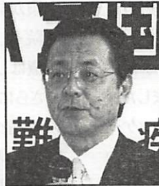
公明党 衆議院議員 江田康幸氏