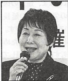
民主党 参議院議員 岡崎トミ子氏

各政党の皆様にお話し、「今後の難病対策をどのように進めるか」について、お話を伺いました。ただし国会の会期中でもあり、すべての政党がそろってご参加いただくわけにはいきませんでした。ここでは、お越しいただいた民主党・公明党・日本共産党からの発言をまとめました。また、その他の政党に関しては、メッセージをいただいた方々を紹介させていただきます。