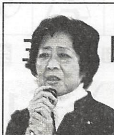
民主党 衆議院議員 (栃県難病団体 連絡協議会会長) 玉木朝子氏