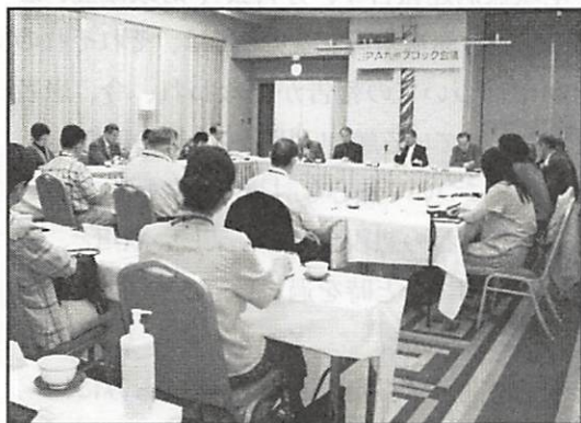
九州ブロック会議

平成 21 年度の J P A 九州ブロック会議が福岡市の「KKR ホテル博多」で 9 月 26・27 日の両日に佐賀・長崎・熊本・大分・福岡・オブザーバーとして鹿児島県「日本リウマチ友の会鹿児島支部」が参加し合計 30 名で開催されました。