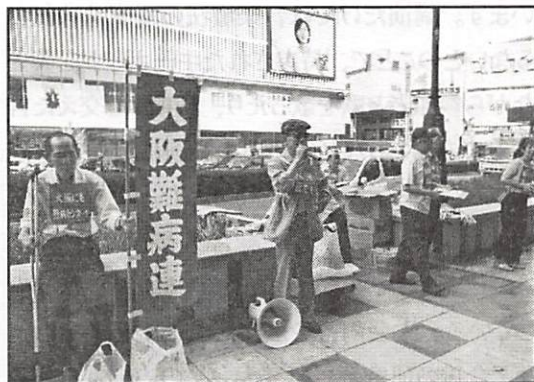
大阪難病連の街頭署名

大阪府でも10月3日(土)に行い、44名の参加で、署名241筆、募金10,685円、チラシ配布1,500枚でした。