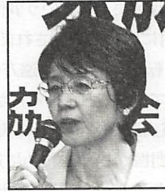
日本共産党 参議院議員 紙智子氏