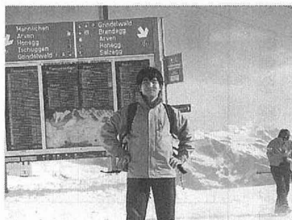
無事スイスアルプスの雪上にて

今回の研修で一番痛感したことは、英会話の力です。研修中は極力英語を使うように心がけ、それなりに通じたのですが、たまに相手から聞き返された時の返答に詰ってしまふことが何度ありました。この点は、これからの大学生活の中で自分の英会話をより高いものにし、本当の意味での使える英語を身につけるように努力していくつもりです。このことを自分の肌で体験できた