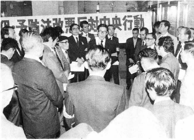
日患同盟の健保・結核予防法改悪反対の中央交渉団は厚生省で決起集会を開き、厚生大臣にそのことを申入れた（昨年秋）