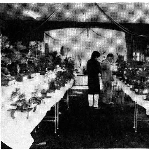
大分県立三重病院の盆栽陳列

あなたは、「薬代の半額を払」を払って入院治療をつづけたいなさい」といわれたらどうか。それとも、治療途中で退院しますか。今まで通り通院治療しますか。をうけますか。 あなたは、「一日千円づつ給」ある「健康保険の改悪の中心」食代を払いなさい」といわれたら、どうしますか。給食代千円 通院治療や入院治療をつづけ