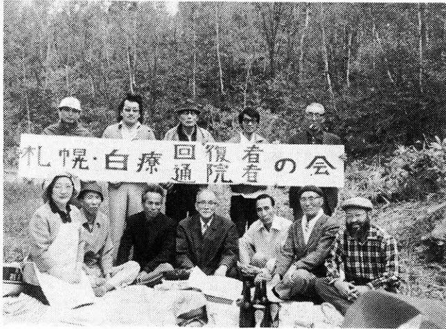
日患北海道連に加入している白療回復者・通院患者の会のレクリエーション

すでに互療会には、北海道、 仙台、新潟、千葉、東京、静岡、 が、徳島、富山、三多摩(東京)