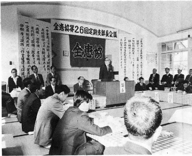
岡山の邑久光明園で開かれた全患協26回支部長会議

邑久光明園で開かれた一九七九年の全患協支部長会議は、十三支部代表の総意によって、長島架橋促進の特別決議をしました。愛生、光明の両施設がある長島(写真一面)は、岡山県の