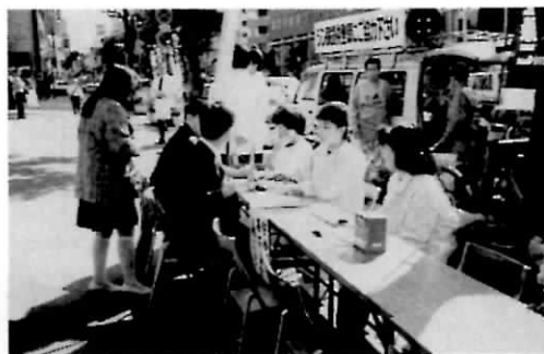
1989.10.8. 腎キャンペーン風景 (札幌)