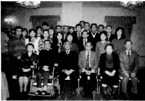
新年会参加者全員で

もともと会の運営は病院の協力と理解により、のびのびと自由に行って居り、会設定日も勝手に決めましたので院長先生が他の重要会議と重なりましたが相談役の栄養課長さんをはじめ透析スタッフも多数参加して頂き、我々の会も