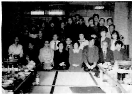
新年会に参加したみなさんで

楽しい時はあっという間に過ぎるもの、宴会もお開きの時間が来ました。この場を開け渡すのも惜しい気もするが、いざしかたがな