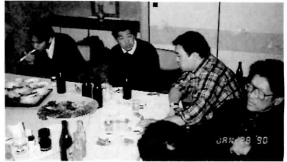
食事は塩分ちょっとひかえ目

患者に交じって一人だけのスタッフの為に最初は遠慮気味でしたがすぐにリラックスして、飲みっぷりも立派な事、話し声も笑い声も豪快で、皆んなしばしばその彼