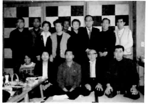
伊達日赤病院 腎友会の皆さん

増を計り、脳死の問題の解決を計り、どこかの病院でも腎移植が出来るような体制を早急に実現してもらいたいことです。