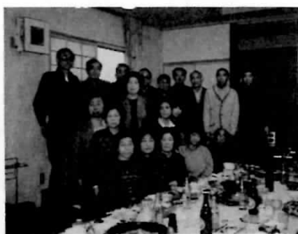
食べきれないほどごちそうが

ん。 尚、今回の取り組みについて、会としては、予定をしておりますが、なかなか取り組めずいた所、一人の会員の方が「ぜひ、やろうよ」と、云って来たので「まかせから、やってよ」と云うと「よし、やってやるよ」といい、