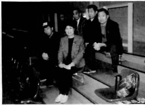
夕張腎友会の参加者たち

全員の準備体操に始まり①フォークダンス、マイムマイムを踊り、②スポーツで仲間をつくらうということでミニバレーボール大会、一二チームの対抗戦、卓球、バトミントンの自由参加などで午