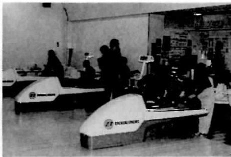
和気あいあいの中にも真剣さが...