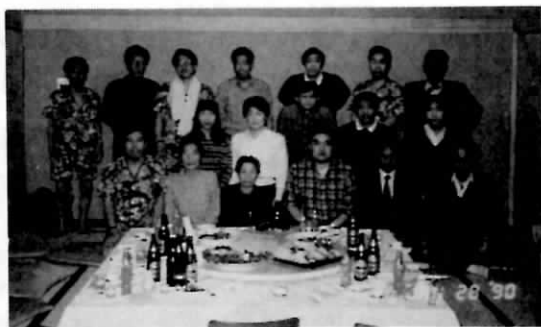
早くもムームー姿の人もいます

いよいよ会長の挨拶で宴は始まりました。時計も1時を廻った頃、皆んなお腹も空いていて、乾