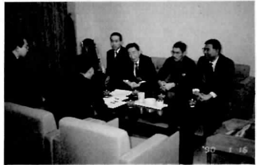
J R職員と道腎協役員