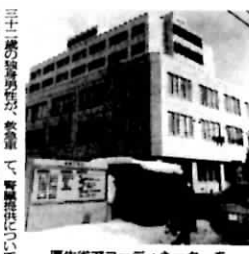
国立長崎中央病院の医療チーム＝長崎県大村市久原2丁目の同病院で(同病院提供)

「移植コーディネーター」が家族から死体腎を橋渡しする。左から長崎中央病院の医療チーム、長崎県大村市久原2丁目の同病院で(同病院提供)。