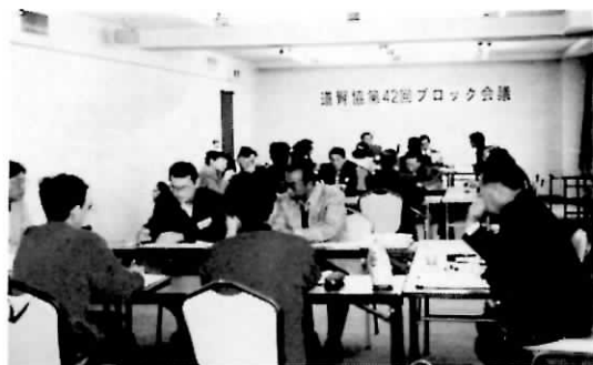
ディスカッションの風景

出席者が3つのグループに分かれ、未加入患者問題や後継役員育成などについて話し合われました。