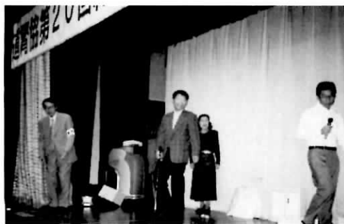
ジャガパットゲームで盛り上がる

は大違い、まわりはアード、コールドと勝手に喧嘩がぐがぐ、頭は混乱し、体は思う様に動かず、正に舟頭多くして、舟何とやらで冷汗だけがふえ、身のやせる思い、健気にも仕事をやりくりし、昼といわず夜といわず日曜日までも練習に明けくれたのですが、「人生必ずしも努力が好結果を生むとは限らない」という教訓を学ぶだけ、そしてとある日一人がボツと呟いた「オモシロクナイ」、云ってはいけないその一言に一同ガーンと落ちこんで暗くなるばかり。そうこうしている内にも日はおしせまり、そこで出た最後の開き直り、火事