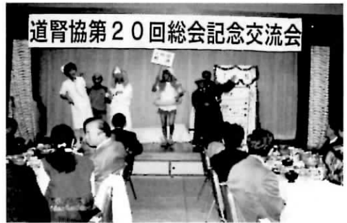
札幌のメンバーによるお笑い劇場

今年には20回の記念総会ということで、地元である札幌腎友会としても何かやろうということになったのですが、ハテサテ…？しかし、さすが1、2000名を擁する札幌腎友会、事務局長自らが、年明け早々にも台本をもっていそいそと現れ披露したのですが、下品！！イヤシイ！！と眉をひそめられ、渋々書き直したのではあるけれど、大して変りなく呆れられる始末、だがそこは1、2000名もいれば、悪のりする輩も多く、恐ろしくも実行することになったのです。私も何を血迷ったのか異常にハイな気分になっていったのか、看護婦の白衣を借りてきたのがまちがいで、女装し化粧までするハメになったのです。しかし観ると演じるとで