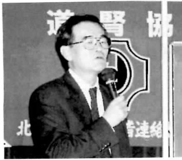
長生きをテーマに講演する今先生