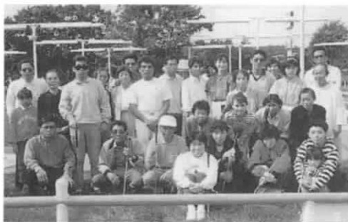
岩見沢腎友会：パットパットゴルフ

そのほか、勉強会・講演など楽しい催しとして各地でそれぞれお花見・山菜とり・一泊旅行・ボーリング大会・炊事遠足等、札幌では昨年新たに文化交流活動として映画鑑賞会が行なわれました。これらのレクリエーションでは、同じ透析患者、家族、さらに病院スタッフも参加し、悩みを話し合ったり、食事、健康管理、合併症などの情報交換の場にもなっており、一人一人のつながりを深めています。皆さん、このような活動を道腎