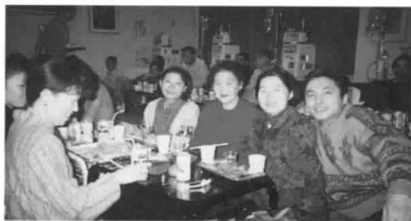
透析室でのクリスマスもなかなかです

その後、乾杯から宴会へと移り棒引きゲームに一喜一憂し、全て抽選が終わった後に、はずれクジの中に特別賞がありますと発表があると、皆一斉に盛り上がりました。敗者復活戦の結果、特別賞は院長にあたりましたが、院長の厚