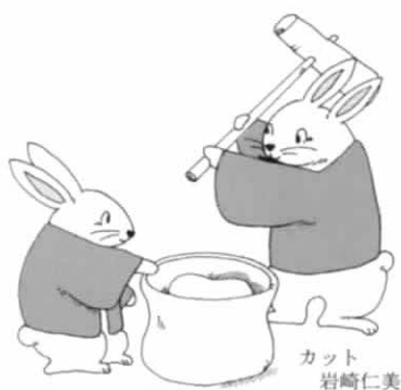
カチカチ山 岩崎仁美

もう一つ日本昔話で有名なのが「カチカチ山」です。この話にはちよつと残酷なシーンがあるので、最近ではあまり語り継がれていな