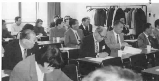
真剣に耳を傾ける出席者

で家族の方に送られてくる、ベッドまで家族の方に世話してもらっている患者さんが数人はいらっしやる状況だと思います。北海道のあなたの施設だけの話ではなくて、いま全国で6千箇所くらいの透析施設があるのですが、その大部分で同じような状況がみられるという事です。