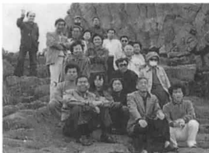
釧路腎友会：一泊旅行