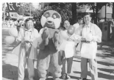
札幌腎友会：腎キャンペーン

街頭キャンペーンは昨年18回目となりました。一昨年、臓器移植法が施行されてから一年半、脳死による移植は全国で一件もない(平成11年1月末現在)中ではありますが、多くの方々には理解と協力を求め、全道で臓器提供意思表示カードを1万3千枚配布しました。