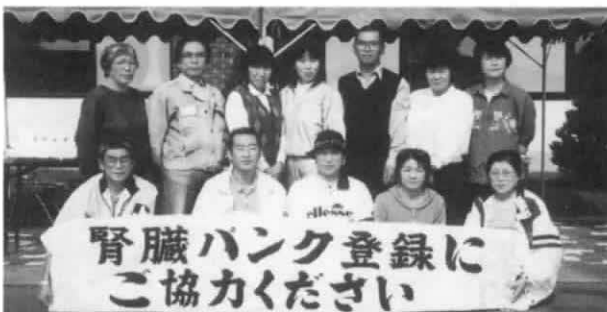
千歳のキリンフェスティバル'98にて