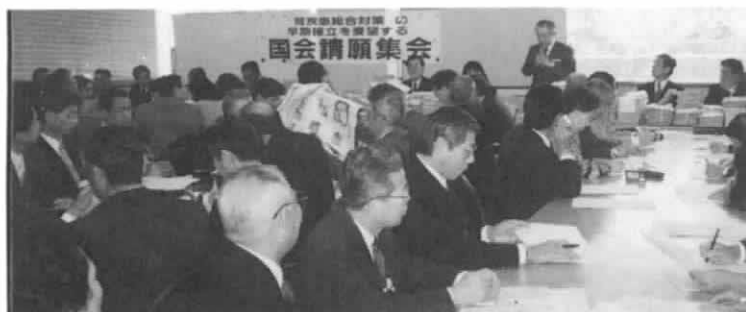
国会請願前の集会

全腎協の年一度の国会請願・署名募金運動があります。これは、「腎疾患総合対策」の早期確立を要望