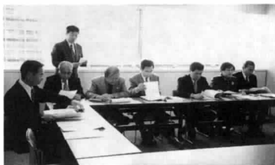
道庁での意見交換会

新世紀の2001年は全世界に衝撃を与えたアメリカでの同時多発テロなど暗い事件が多く、又、日本においても、先の見えない経済状況の中、倒産・リストラによる失業者の増加等、国民にとつては大変な痛みをとまなう年であり