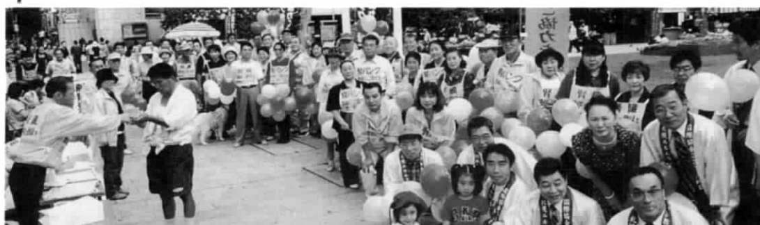
腎 キ ャ ン ベ ー ン