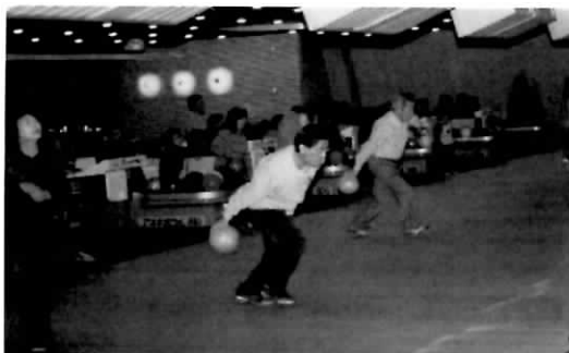
札幌 多数参加のボーリング大会