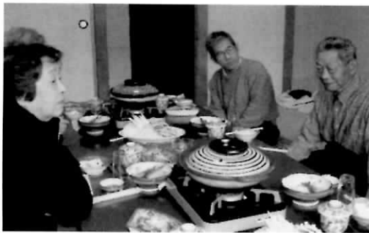
三笠 湯の元温泉で鴨鍋を囲む

してレクリエーションや旅行等、より自分の病気を知り賢く透析生活を送れるようにと医療講演会・勉強会などの催しが行われています。腎提供者拡大キャンペーンは、脳死及び心停止後の献腎移植への理解と協力を市民に訴え、自分自身のためだけでなく透析患者全体のために行われます。