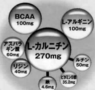
配合栄養成分(1本50mlあたり)