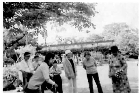
小樽 温泉日帰り旅行でゲーム

これらの活動は決してそれが単独で存在するものではありません。催しに参加し同じ透析患者同志の話しの中で情報交換したり、交流会で同じ楽しみを共有しコミュニケーションを深める事は、市町村に私たちが必要な事を要望する時にも、スムーズな連携の土台です。 道腎協は昭和52年、29年前に全道の7つの腎友会が集まり結成されました。今では全道でオプザーバー参加も含め