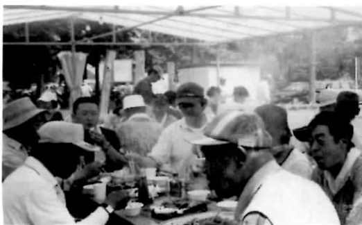
十勝 パークゴルフ後の焼肉交流会

28の地域腎友会が道腎協に参加しています。現在の医療費一部負担や透析環境悪化傾向の中では、これ以上透析患者の生活の質を下げないために一人一人のコミュニケーションと協力が大きな力を発揮します。地域腎友会の一人一人の皆さんが、道腎協・全腎協の基本的体力です。写真は各地域腎友会の催しのひとコマです。皆さんも各地の腎友会の催しに是非参加して下さい。