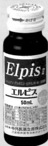
内容量:50ml/瓶 発売元:エルピス株式会社 製造元:中外医薬生産(株)