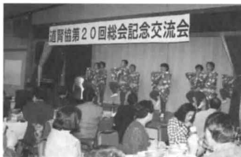
総会記念交流会（定山渓）

本人自己負担2割や薬剤費一部負担など、私達をめぐる医療と福祉の状況は一段と厳しくなってきました。このような時期に患者会活動の活性化は、ますます重要になってきます。平成9年10月16日から臓器移植法が施行され、腎臓移植については、従来の規定に基本的には変わりありませんが、実際にはこの数年来、死体腎移植の症例が大幅に減っている状況があり、