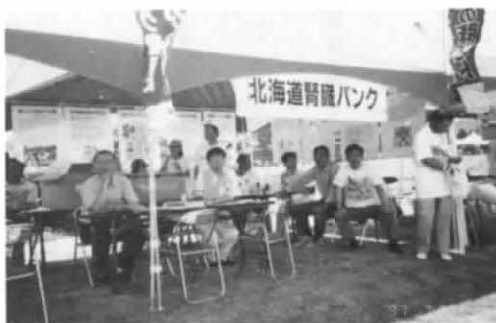
'97キリンフェスティバルにて (千歳)

かに透析医療が進んでいるかスライド等をつかい大変有益な内容でした。 (また、前日(24日)の交流会は定山溪ホテル鹿の湯において全道各地から100名の仲間で開催され、特に札幌腎友会の皆様方には大変ご苦労をお掛けしました。) (3) 腎提供登録者拡大運動 について 第17回腎バンク登録者拡大キャンペーンとして道腎協も昨年は10月5日(日)に実施いたしました。(一部のブロックは除く)