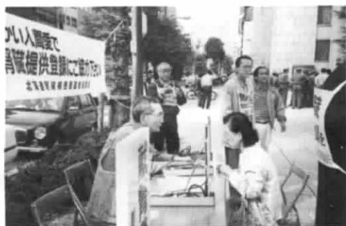
腎キャンペーン (札幌)

かに透析医療が進んでいるかスライド等をつかい大変有益な内容でした。 (また、前日(24日)の交流会は定山溪ホテル鹿の湯において全道各地から100名の仲間で開催され、特に札幌腎友会の皆様方には大変ご苦労をお掛けしました。) (3) 腎提供登録者拡大運動 について 第17回腎バンク登録者拡大キャンペーンとして道腎協も昨年は10月5日(日)に実施いたしました。(一部のブロックは除く)