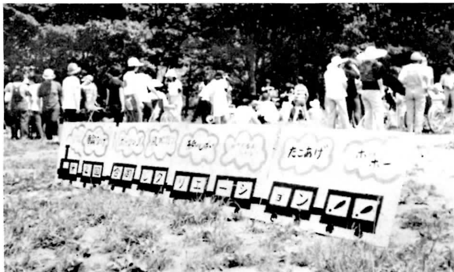
第2回難病連合同レク（藻南公園にて）6月25日