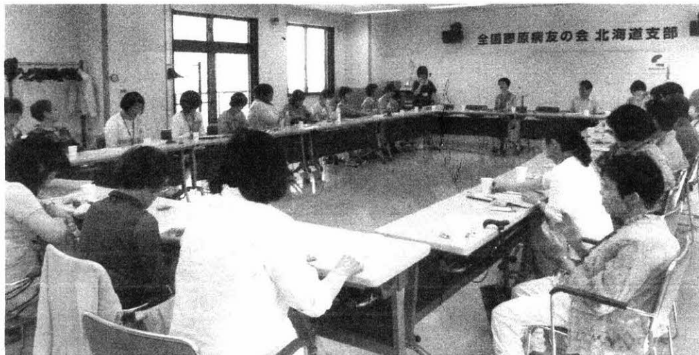
(昨年の総会の様子)

参加ご希望の方は、 5月31日(必着)までに はがきを切って郵送、あるいは そのままFAX(堀内 )で 返信してください。