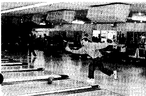
親睦ボウリング大会

山の応援の中元氣一杯の投球で始まりました。あちらこちらでスベアやストライクの嵐、一時間があ