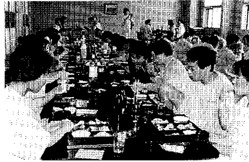
モエレ健康センター