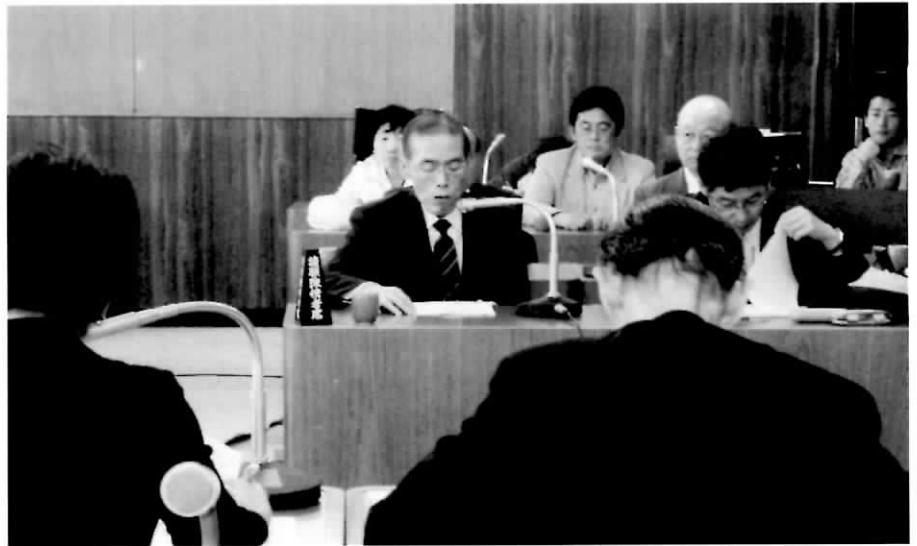
札幌市議会趣旨説明

(2) 腎臓提供者拡大に関する運動 九月二八日(日)、大通り三丁目において道腎協と共催で札幌市保健所医療政策課・市立札幌病院腎移植科・北海道腎臓バンク・北海道移植者協議会・札幌スノーライオンズクラブ・札幌エルムライオンズクラブ・北海道難病連の七団体と各施設の患者・家族五八名の参加