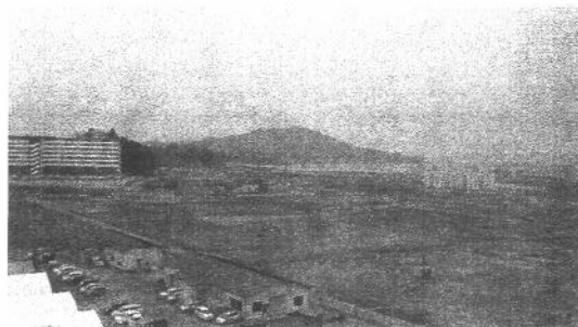
復興はまだまだ・・・