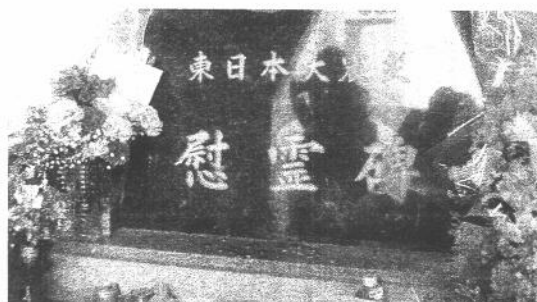
ご冥福をお祈りいたしました