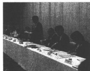
岩手県保健福祉部長との懇談会より