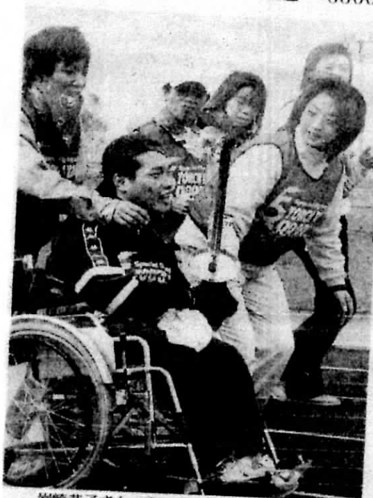
岩崎恭子さん(右)とともに、聖火を運ぶ障害者ら