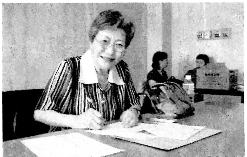
7議員への要請行動を終えて、行動報告書作成

入会から30年、初参加の請願行動でしたがこれからの活動に役立てていきたいと考えております。貴重な体験の機会を下さった皆様に御礼申し上げます。