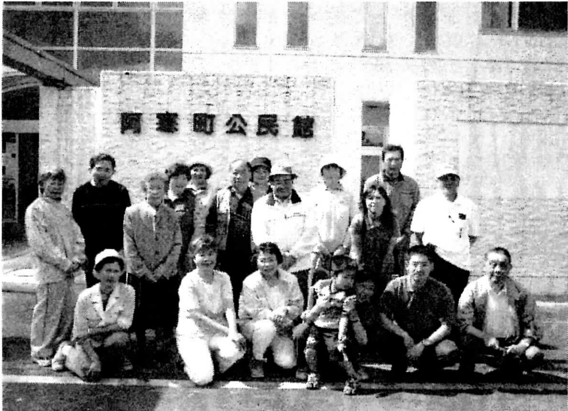
2007年度 (財)北海道難病連釧根地区合同レクリエーション 阿寒町にて