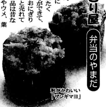
形がかわいい「ザンギマヨ」

いうおにぎり。細かく刻んだザンギをマヨネーズで味付けした具が意外にもあっさりとしていてご飯によく合い、おいしかった。