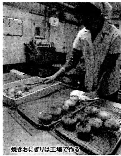
焼きおにぎりは工場で作る

おにぎりの中の具や赤飯、焼きおにぎりなどは釧路市鶴ヶ岱にある工場で作っているが、のりで包む普通のおにぎりはできるだけ作りたてのものとすべて店