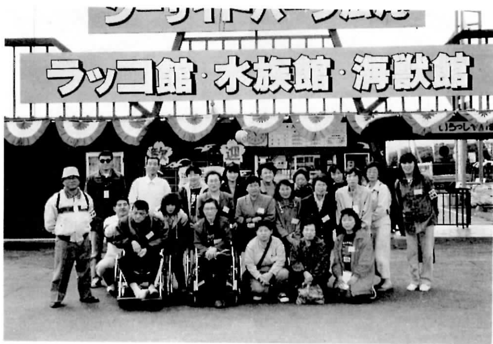
合同レクリエーション (広尾にて)