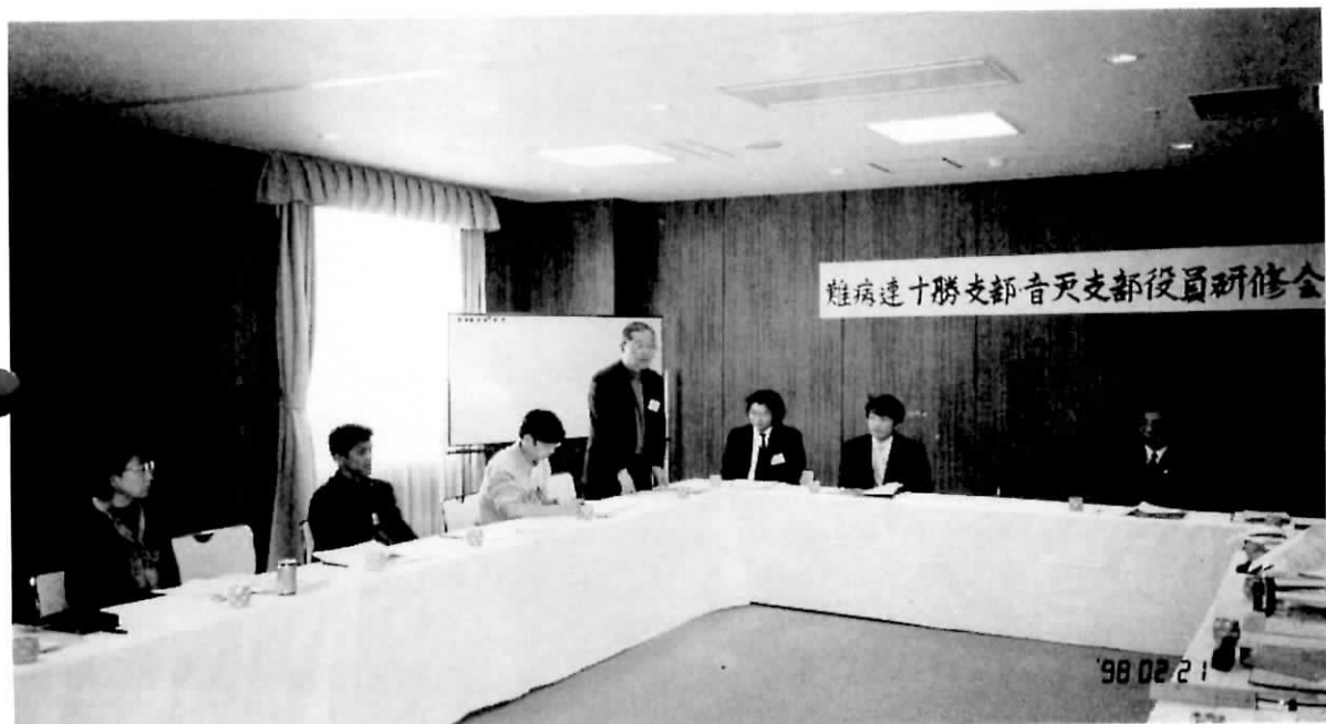
支部役員研修会（緑館にて）