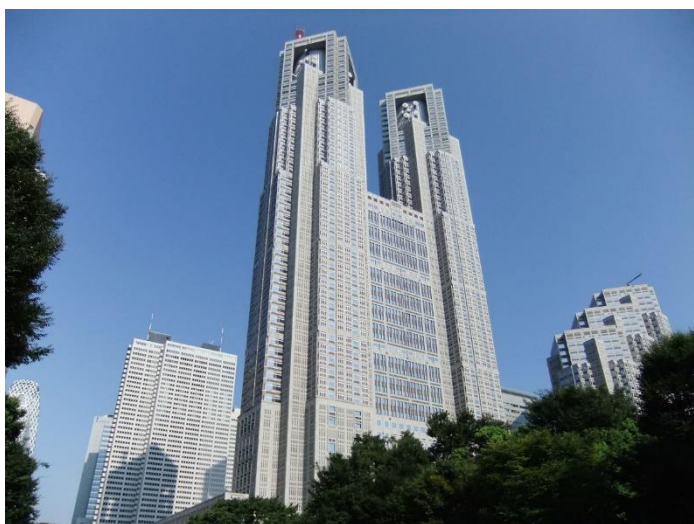
東京都庁舎(新宿区)