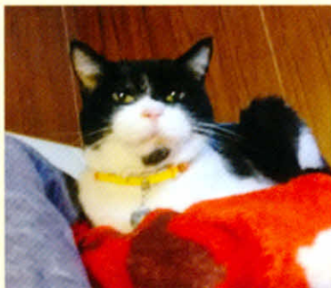
道路の真ん中で車に接触して、うずくまっているところを保護。顎下の黒いブチがチャームポイント!