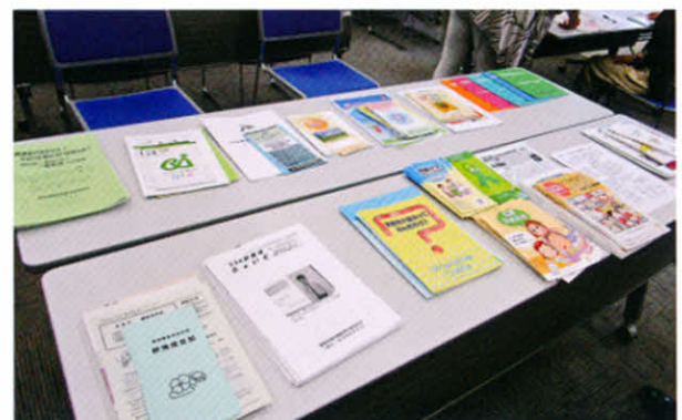
各患者会の資料展示