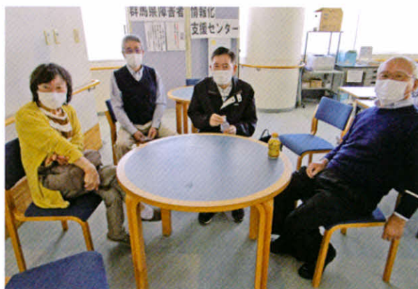
難病サロンの様子