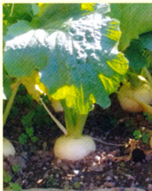
今年も美味しい「かぶ」が出来ました!