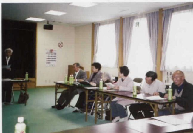
6.15 むつ市・あすなろ会患者家族交流会