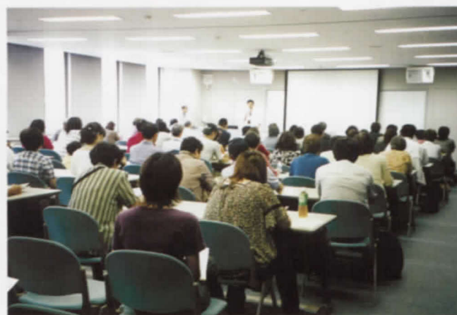
7.19 てんかん協会「最新のてんかん手術講演会」