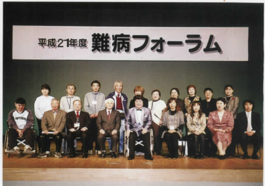
ご協力いただいた皆さん方