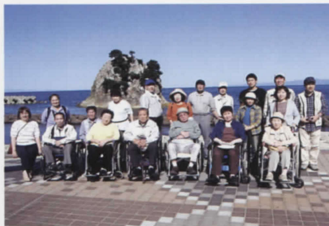
9.20 青森SCD・MSA患者友の会交流会