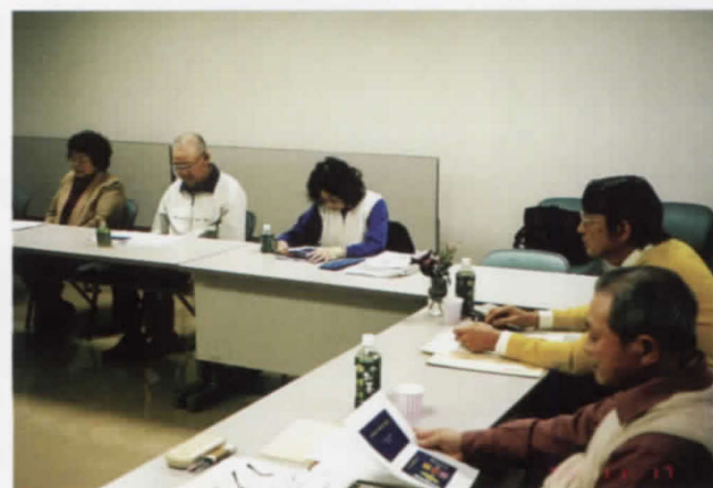
11.17 みさわ・もみじ会医療相談・患者交流会