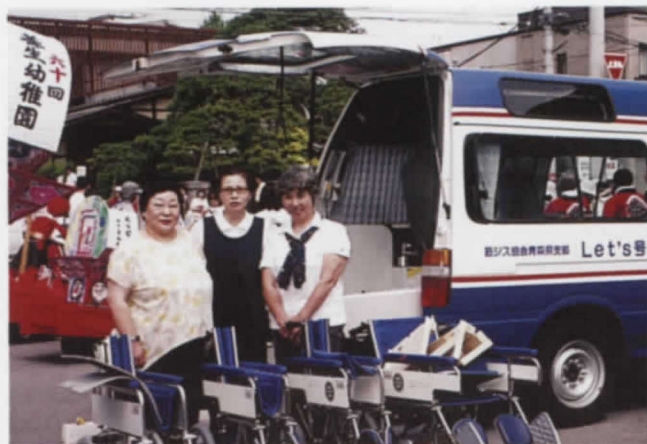
7.6 ALS協会 鳩の会より新品車イス4台寄贈される