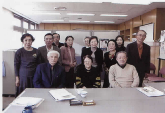
12.9 青森パーキンソン病友の会役員反省会