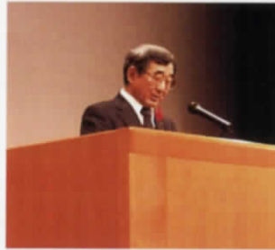
祝辞を述べられる 五所川原市長 平山誠敏様