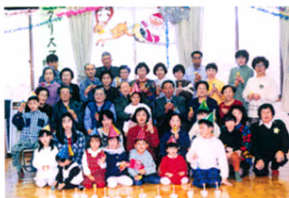
みんな揃って、メリークリスマス