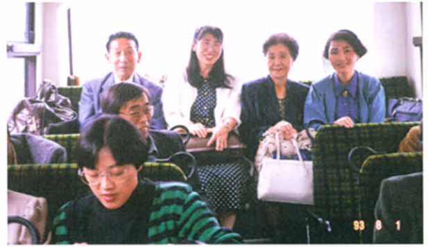
H5.7.31～8.1 第20回全道集会難病連結成20周年記念(バスの中)(教育文化会館・グリーンホテル札幌)