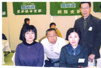
高田代表理事も一緒に(役員研修会)