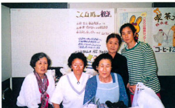
S59.7.8 厚岸・浜中難病検診相談会