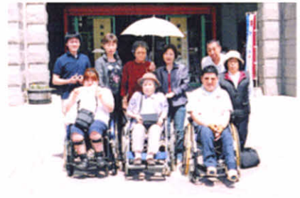
H18.6.24~25 厚障連研修旅行(東藻琴村)