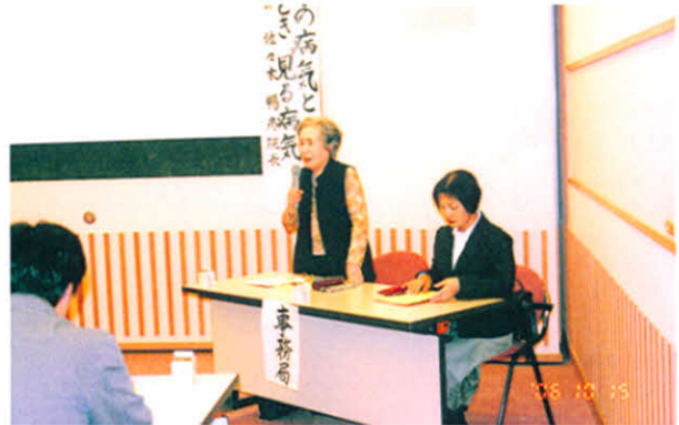
H18.10.15 「よくある子どもの病気と ときどき見る病気」医療講演会(厚岸情報館)