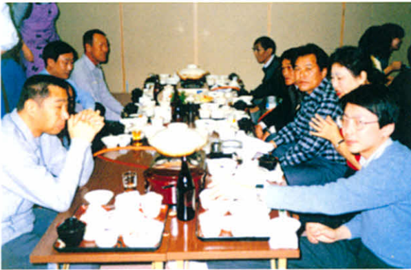
S61.2.22～23 道東地区支部役員研修会 (中標津町.保養所温泉)