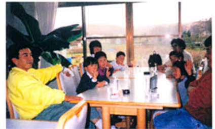
交流会に参加するご家族