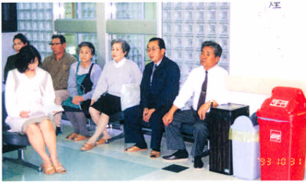
H5.10.31 難病無料検診・相談会(町立浜中診療所)

7・30 2名参加 釧路地域合同レクリエーション(釧路市柳町パークゴルフ、釧路ヒルトップホテル) 4名参加 8・27 健康まつり協賛コーヒESHヨップ出店(社会福祉センター) 9・15 第1回ブロックレクリエーション(釧路市) 9・23 支部研修旅行(養老牛〜網走) 12名参加 町より車、保健婦同行 11・8 15周年記念事業最終打ち合わせ 7名参加