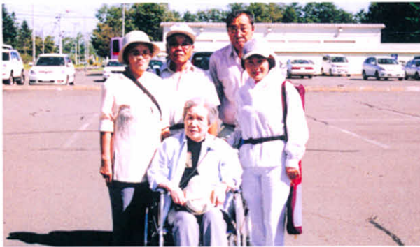
H17.9.11 釧根地区支部合同レクリエーション(鶴居村)