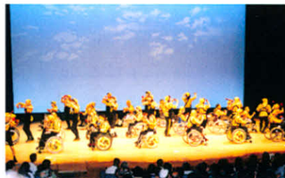
車イスよさこいチーム