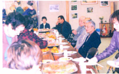
沢山のご馳走です(厚障連新年会)