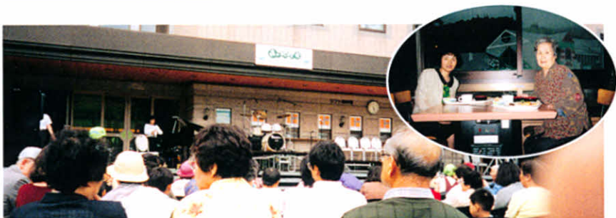
H10.6.27 森のおんがく会(キロロリゾート)