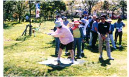
H5.9.19 釧根支部合同レクリエーション(阿寒丹頂の里パークゴルフ場・赤いペレー)