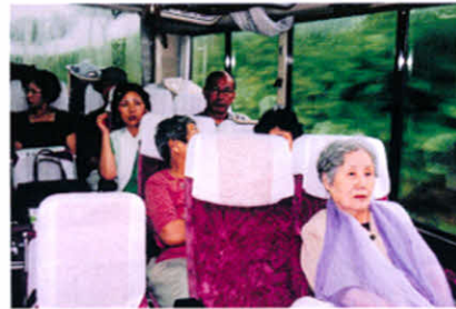
十勝支部ほかのみなさんとバスで七飯町へ