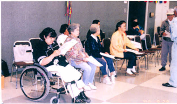
ふれあいフェスティバル会場のような