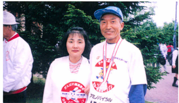
H11.6.20 サロマ100キロウルトラマラソン応援 (常呂町)