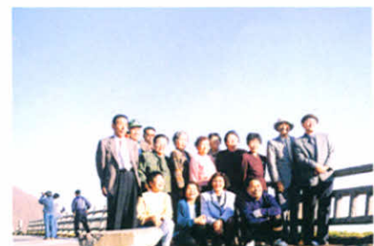
H7.10.12～13 身障分会合同研修旅行 (糠平・音更)