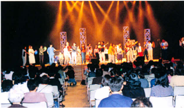
H11.9.16 ロックバンド(手話)・シャンテ公演

9・19 「走れ! ひまわり号」協賛 喫茶コーナー(子野日公園) 200名参加 10・10 赤い羽根街頭募金(子野日 公園) 3名参加 11・6 釧路支部設立20周年記念事 業(釧路市) 5名参加 11・14 「橋本病」医療講演会(厚 岸情報館) 30名参加 11・29 日本一周マラソン・ゴール イン出迎え(札幌市) 1名 参加 12・11 身障分会合同クリスマス家 族交流会(社会福祉センタ ー) 32名参加