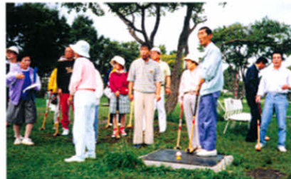
H4.9.15 第1回ブロックレクリエーション（釧路市）