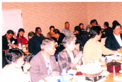
道東地区支部役員研修会