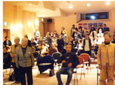
参加者も早速、会場内で起立！ （医療講演会）