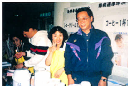
H8.9.28 すこやか健康福祉運動会ふれあいの店出店(社会福祉センター)