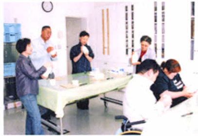
アイスクリーム作りに挑戦。振って、振って!!