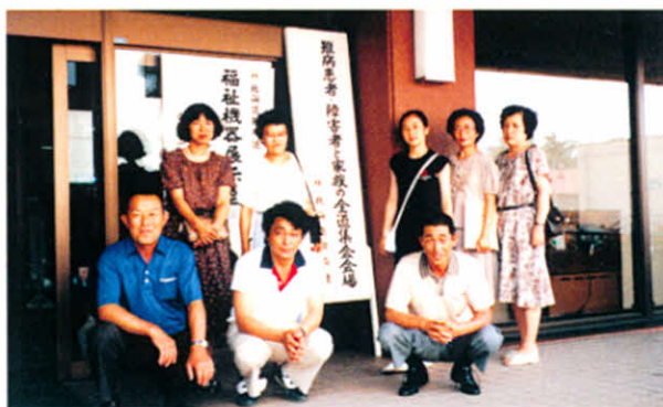
旭川市勤労者福祉会館にて