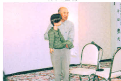
佐田さんによる腹話術