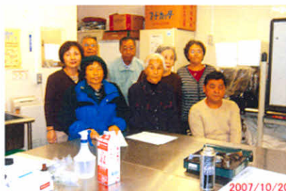
リフレにてアイスクリーム作りに体験