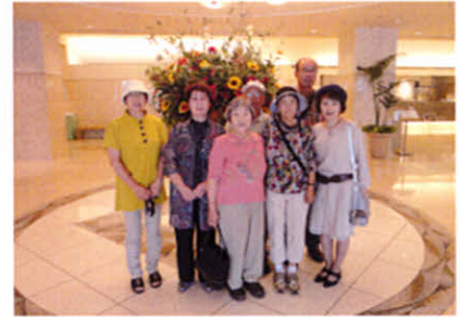
皆さん身軽になってホテルロビーにて(全道集会)