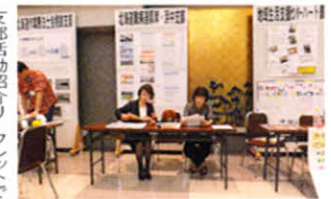
支部活動紹介リーフレットでポスターセッション （ふれあいフェスティバル）