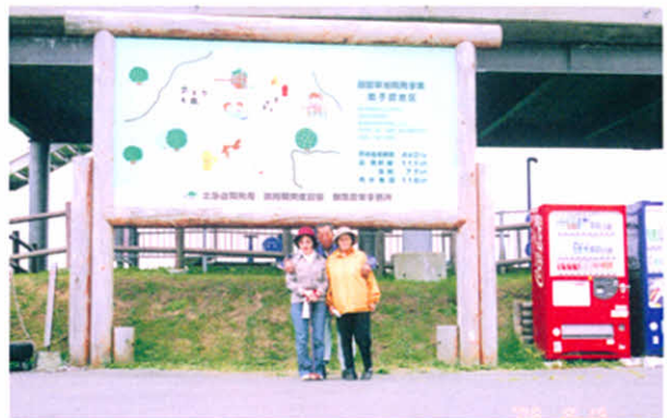
H18.9.16 釧根地区支部合同レクリエーション(弟子屈町)