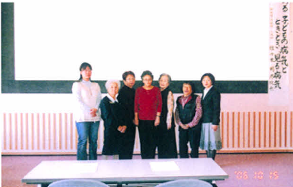
医療講演会後の記念撮影