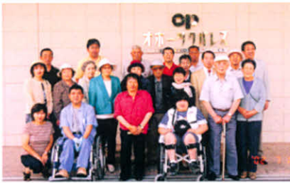
H14.7.13~14 厚障連研修旅行(紋別市)