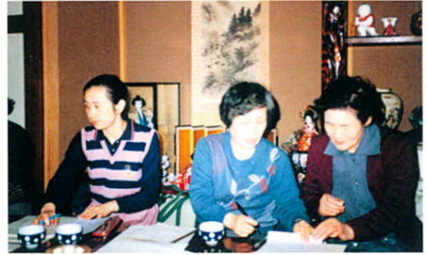
S59.3.3～4 道東地区支部役員研修会 (根室市、民宿エクハシにて)