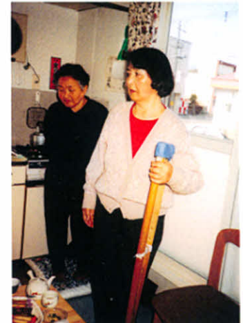
松葉杖片手に真剣な眼差しで…