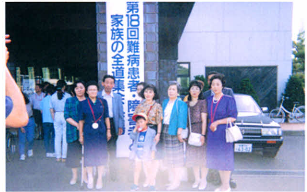
H3.7.27～29 第18回全道集会(洞爺湖温泉)