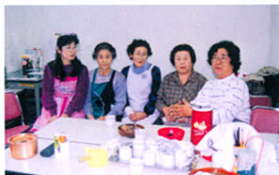
ちょっと、ひと休み…