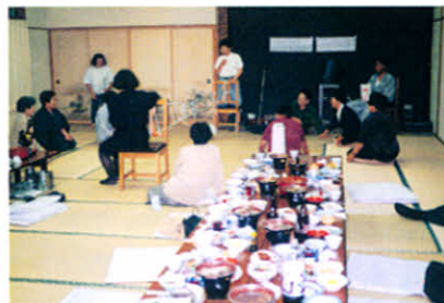
さあ～皆さんがんばって!!