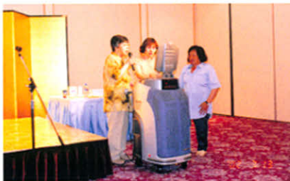
カラオケで盛り上がりました