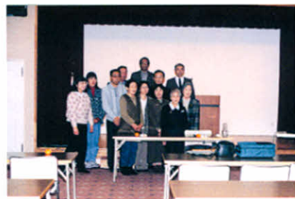
2日間の研修会、おつかれ様でした