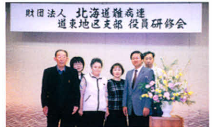
H16.2.21~22 道東地区支部役員研修会(弟子屈町)