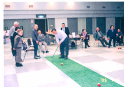
ゲームでひと汗流して