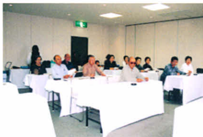
H9.10.25~26 身障分会合同研修旅行(幕別温泉)