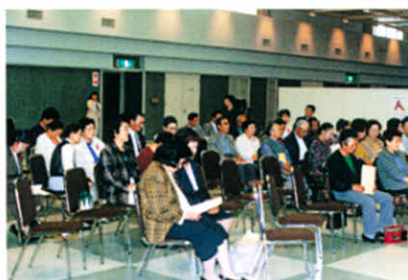
シンポジウム会場のような