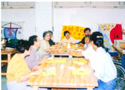
合同レクリエーションでは、 班に分かれてテーマ毎に交流も