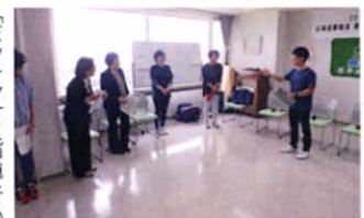
「ボッチャ」を指導者の元、楽しみました （支部総会交流会）