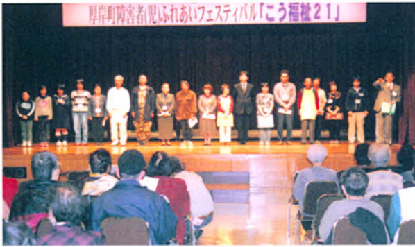
H16.11.14 厚岸町障害者(児)ふれあいフェスティバル(社会福祉センター)