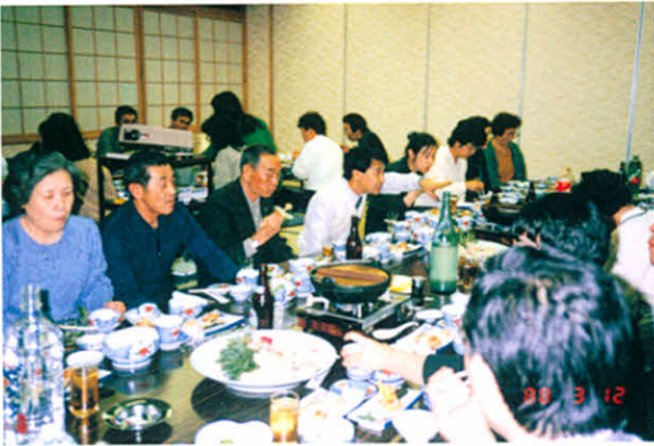
S63.3.12 道東地区支部研修会・会計監査 事業打ち合わせ(鶴居グリーンパーク)