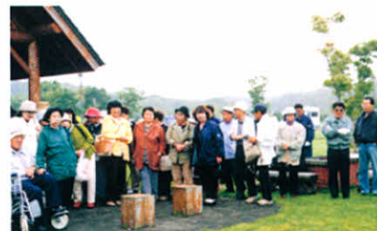
次はどんな楽しみが出るのかみなさんドキドキで!