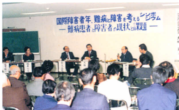
S56.12.5 パネラーの方々からの熱心な発言!