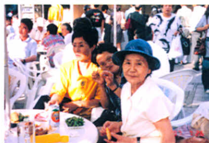
H9.7.26 第24回全道集会(札幌市)