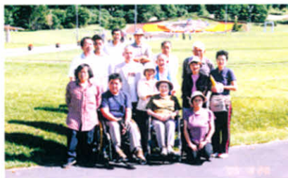
晴天で、みなさん暑そう!