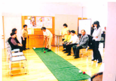
スカットボール、楽しそう!