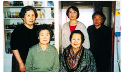
H4.6 リウマチ友の会の集い（田宮宅）