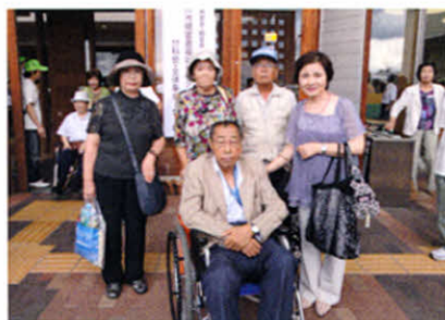
全体集会を終えて～旭川は暑かったわ!～(全道集会)