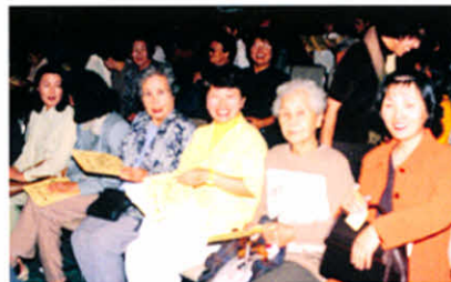
「ステキな演奏でしたね」