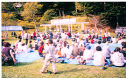
みなさん 青空の下で