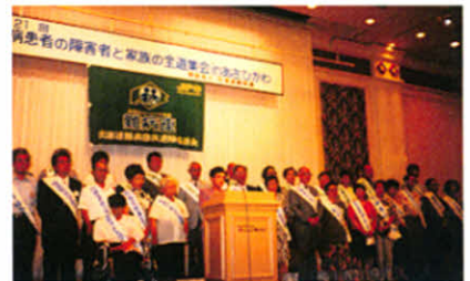
結 束 の 誓 い