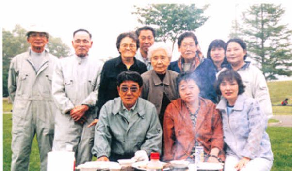
H14.9.8 道東7支部合同レクリエーション(中標津町)