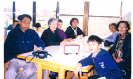
支部長ほか支部役員