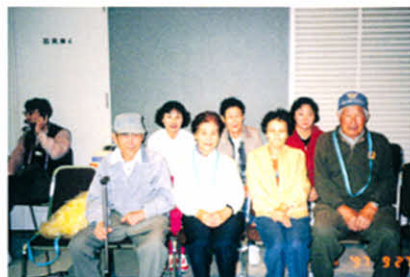
H9.9.27 すこやか健康福祉運動会(社会福祉センター)