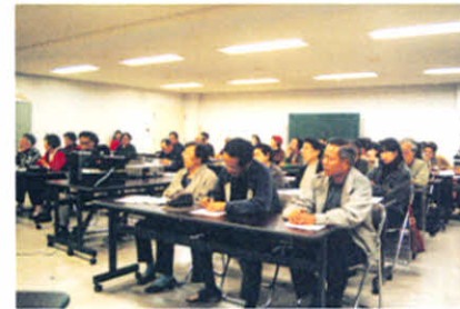
大勢の参加者でした