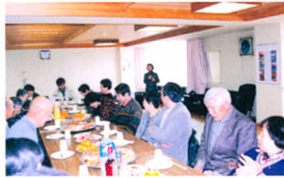
H14.1.27 厚障連新年会(社会福祉センター)