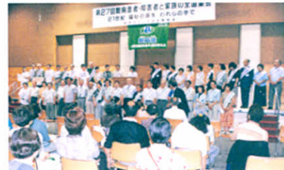
H12.8.5~6 第27回全道集会(函館市)