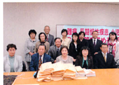
署名簿を前にして、訪問要請前に北海道の仲間(国会請願行動)