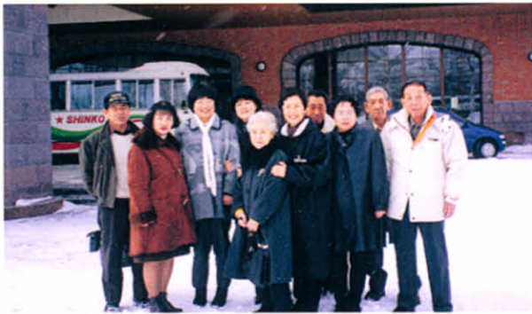
記念撮影(支部役員研修会)