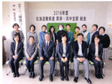
保健所葛西保健師、両町課長と総会を終えて(支部総会)