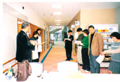
スタッフ打ち合わせ(相談会)