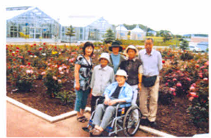
ステキなバラに囲まれて…