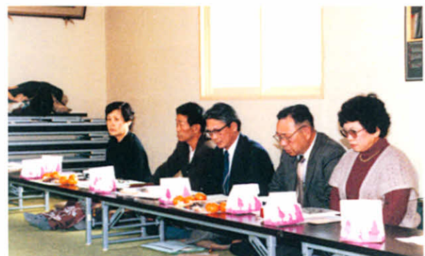
S58.3.5~6 道東6支部合同研修会(阿寒湖畔.雄岳荘)