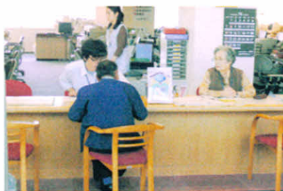
H19.10.14 難病医療福祉相談会 (保健福祉総合センター)