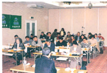
道東地区支部役員研修会