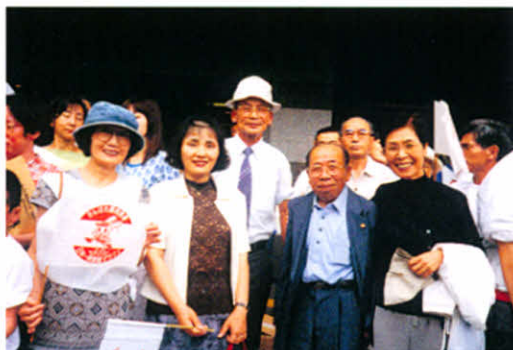
会場前で記念撮影