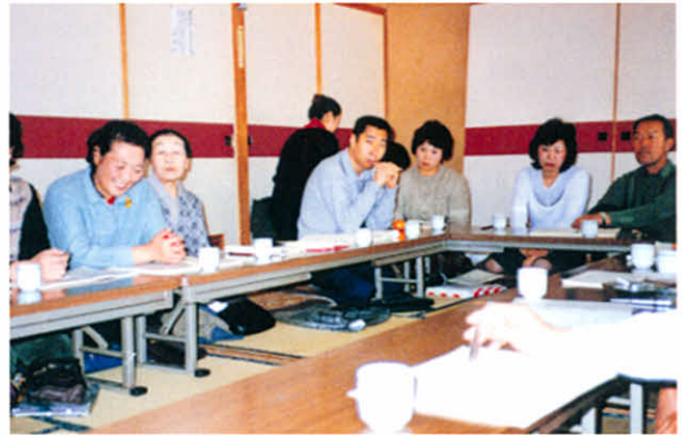
S60.3.2～3 道東地区支部役員研修会 (標茶町.憩いの家かや沼)