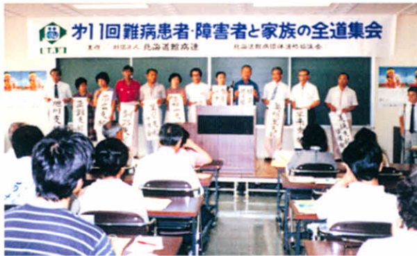
S58.8.7 第11回難病患者・障害者と家族の全道集会(旭川市)