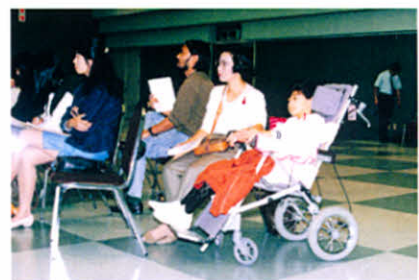
熱心に聞かれておりました