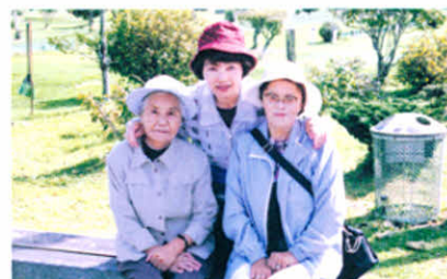
楽しい汗を流した3人(満足顔~スコアは?)