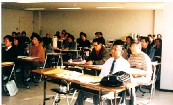
S56.12.5 皆さん真剣な眼差しで…