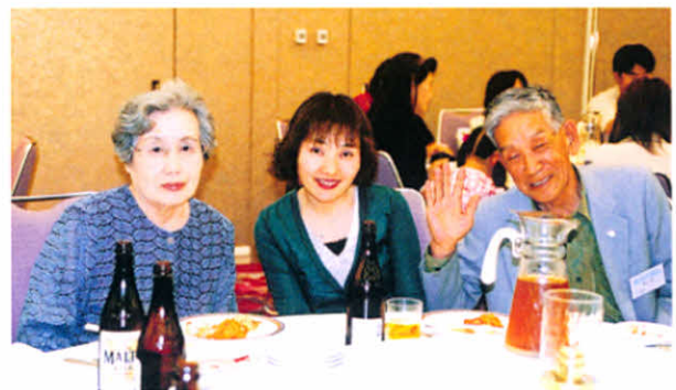
H14.8.4~5 第29回全道集会(釧路市)