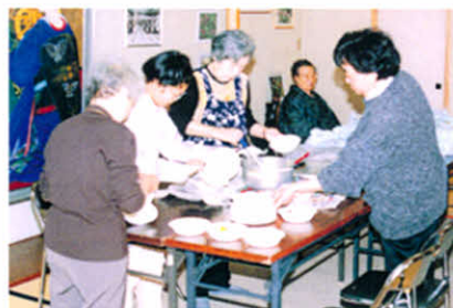
さあ〜ごちそうの出番ですよ!