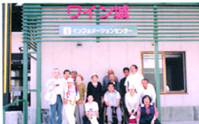
ワイン城にて(厚障連研修旅行)