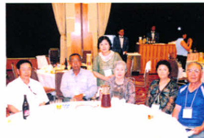
レセプション会場！