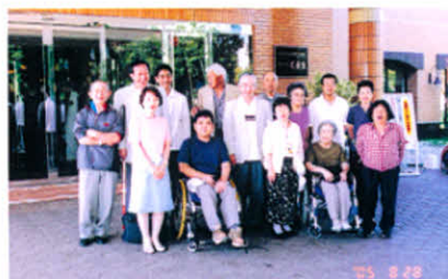
ホテル前で記念撮影