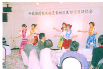
ステキなフラダンスに心温まるひととき