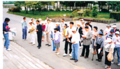
レクリエーション前の開会式