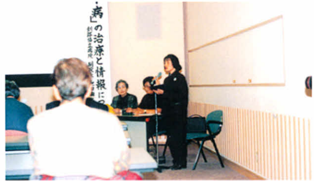
H11.11.14 「橋本病」医療講演会(厚岸情報館)