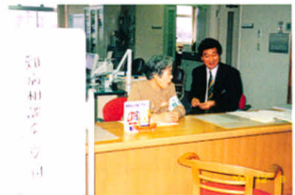
H12.12.3 難病医療・福祉相談会 (厚岸町保健福祉総合センター)