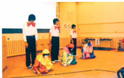
H20.12.14 真龍中学校の先生と生徒さんによるバントマイムの発表