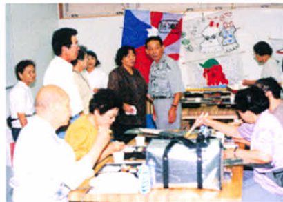
合同レクリエーション交流会