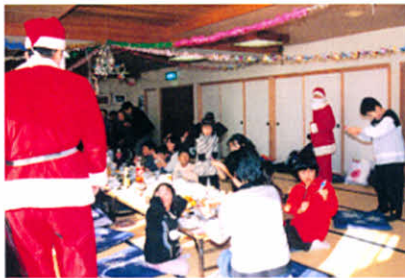
「あっ、サンタさんだ!」