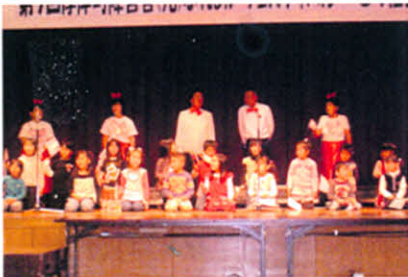
H20.11.9 厚岸町障害者（児）ふれあいフェスティバル（社会福祉センター）