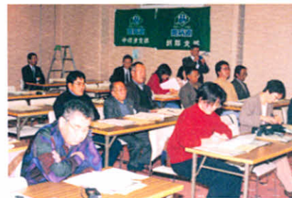
道東地区支部役員研修会