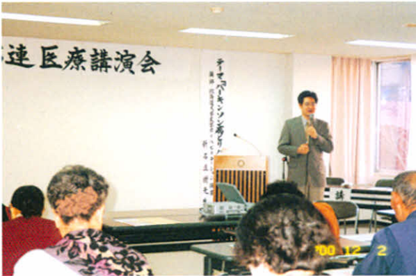
H12.12.2 「パーキンソン病」医療講演会 (社会福祉センター)