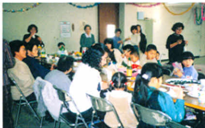
みんなおいしいねえ~!