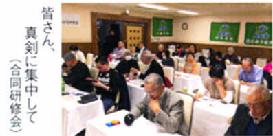
皆さん、真剣に集中して(合同研修会)