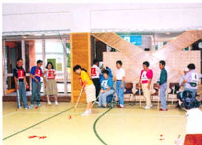
ゲートボール「白熱の戦い」