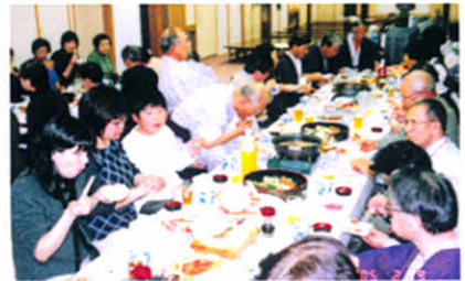
なごやかなひととき(役員研修会)