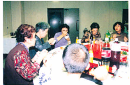
H9.10.25~26 身障分会合同研修旅行の食事風景