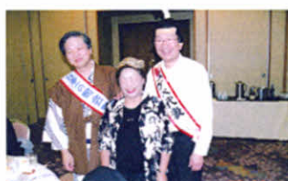
交流会は役者揃い!(役員研修会)