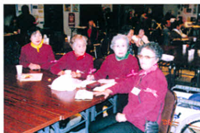
H19.11.11 厚岸町障害者(児)ふれあいフェスティバル (社会福祉センター)