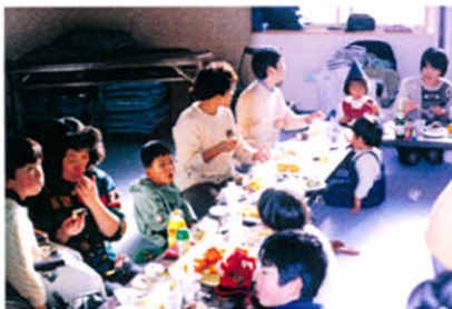
おいしいごちそう、うれしいね…。