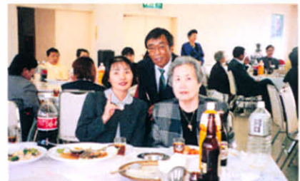
釧路支部設立20周年祝賀会