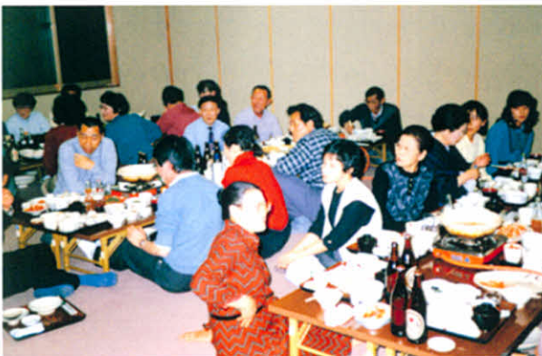
おいしい料理に大満足