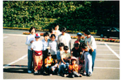
H7.9.15 つばさの会交流会(阿寒湖畔)