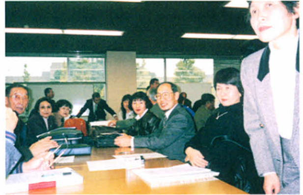
H12.11.19~21 国会請願行動(衆議院会館にて)