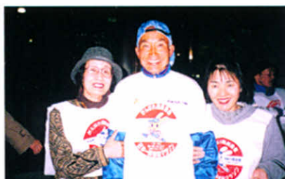
記念に一枚「ハイチース」