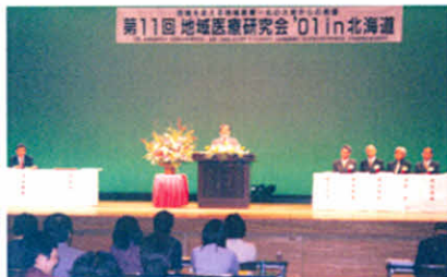
H13.9.23 第11回地域医療研究会(弟子屈町)