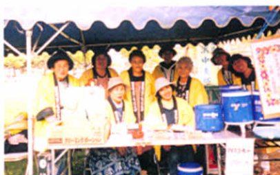
「走れ! ひまわり号」協賛喫茶コーナー