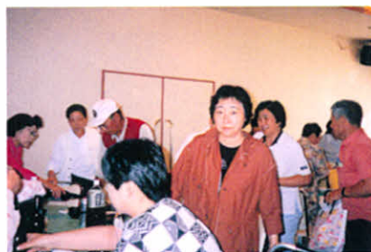
合同レクリエーション親睦会