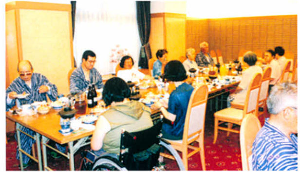
H12.7.29~30 身障分会合同研修旅行(佐呂間町)