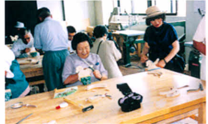
チャチャワールドで木馬作りに挑戦