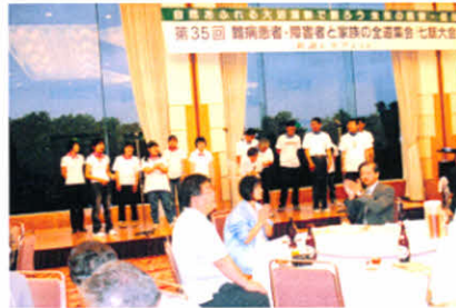
H20.8.2～4 第35回全道集会（七飯町）