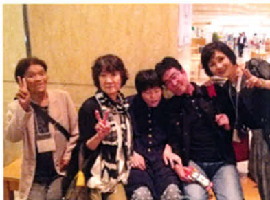
交流会を前に、皆でピースサイン!(全道集会)