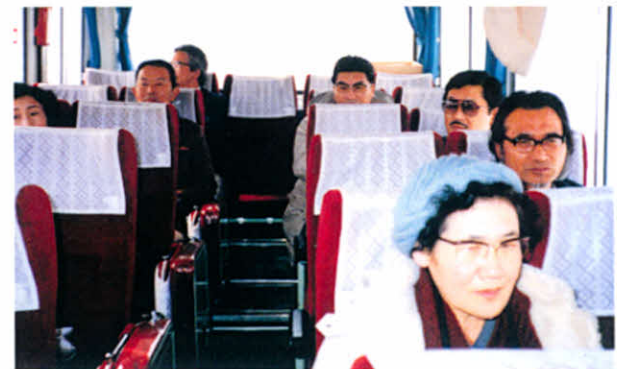
研修会バス中にて