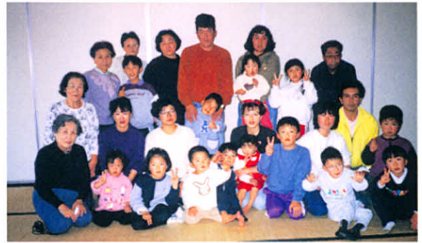
H6.11.6 つばさの会交流会(つるいグリーンパーク)