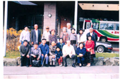
幕別温泉ホテルにて