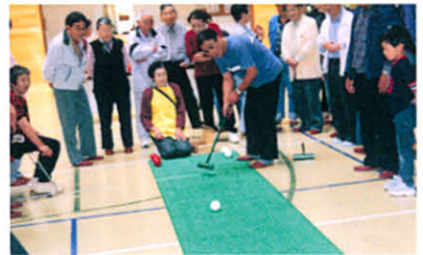
いい汗流した?(合同レクリエーション)