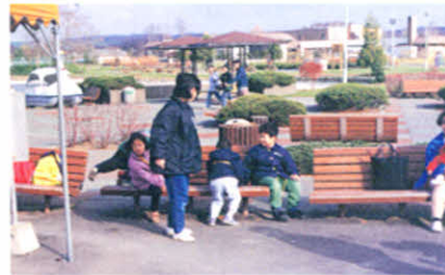
つばさの会交流会で(つるいグリーンパーク)