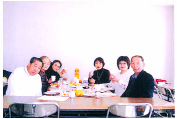
H17.1.8 支部役員新年会(社会福祉センター)