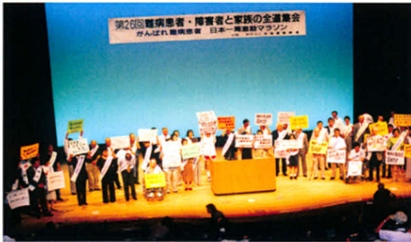
H11.7.31～8.1 第26回全道集会 (札幌市)