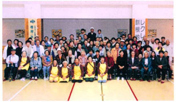
H15.9.28 釧根地区支部合同レクリエーション(厚岸少年自然の家)