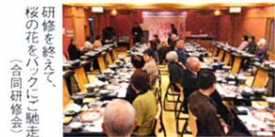
研修を終えて、桜の花をバックに「馳走(合同研修会)