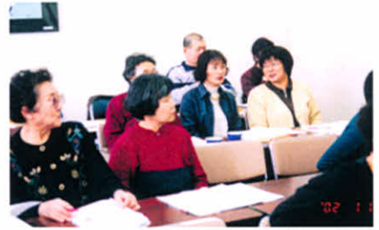
H14.1.19~20 道東地区役員研修会(阿寒町)