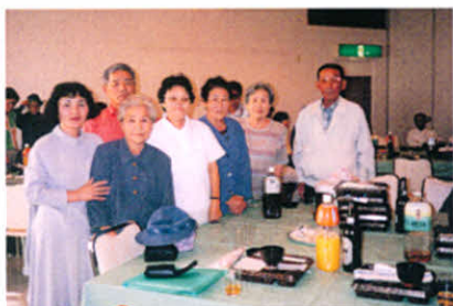
H10.9.13 釧根地区支部合同レクリエーション(ヒルトップ)