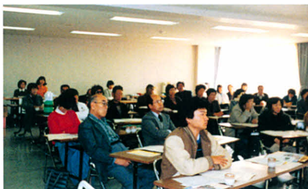
S56.12.5 記憶に残る発言は!?