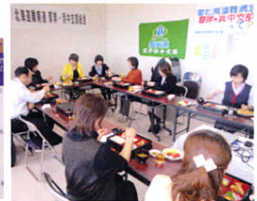
支部総会後に昼食を囲んで交流(支部総会)