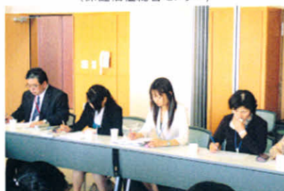
H19.10.14 事後検討会 (保健福祉総合センター)