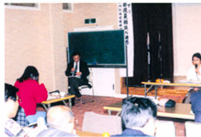
道東地区支部役員研修会