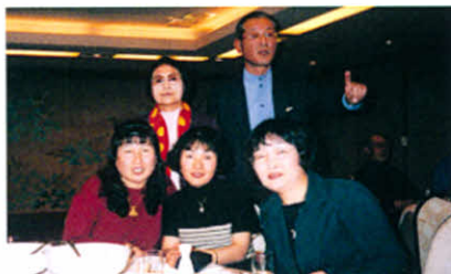
H12.11.17~19 JPC(日本患者・家族団体協議会)研修セミナー(熱海市)