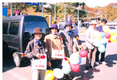
「募金の御協力お願いしま〜す」