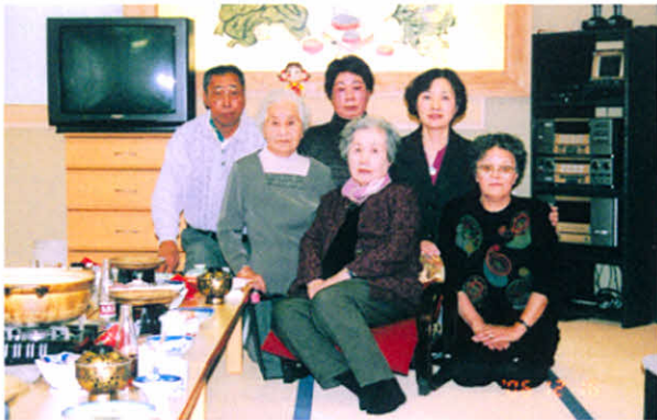
H18.12.16 支部忘年会・役員会(浜中町霧多布)