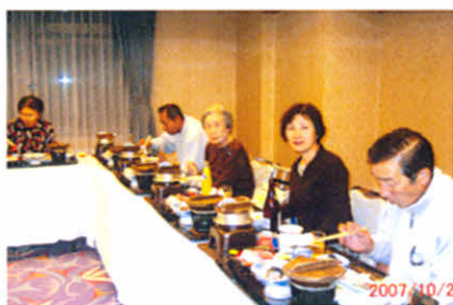
食事の時間(研修旅行)

12・22 支部忘年会・役員会（やま つ）5名参加 11・18 厚岸町社会福祉大会（社会 福祉センター）3名参加 11・11 厚岸町障害者（児）ふれあい フェスティバル（社会福祉 センター）6名参加 10・20～21 身障分会合同研修旅行 （弟子屈町川湯）10名参加 10・14 難病医療福祉相談会（保健 福祉総合センター）47名参 加 10・7 赤い羽根街頭募金（子野日 公園）2名参加 9・15 すこやか健康福祉運動会（社 会福祉センター）3名参加 9・2 釧根地区支部合同レクリエ ーション（阿寒町）8名参 加