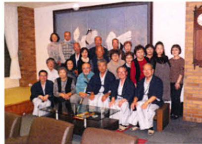
鶴の絵をバックに皆さんスマイル!(合同研修会)