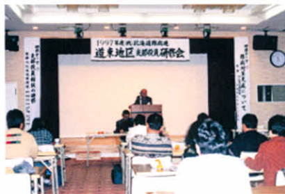
H10.1.24～25 道東地区支部役員研修会(ホテル金万)