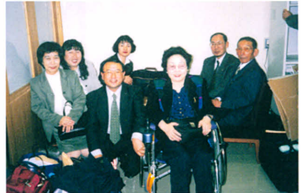
北海道からの参加団(国会請願行動)