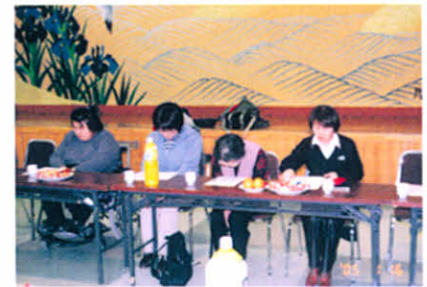
厚障連新年会(役員研修会)