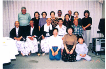
記念撮影「ハイチーズ」