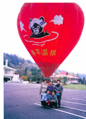
お～っさい気球の前でハイポーズ!!