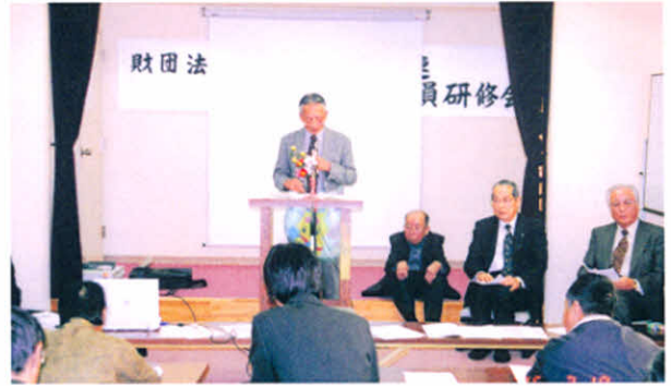
H17.2.19~20 道東地区支部役員研修会(中標津)