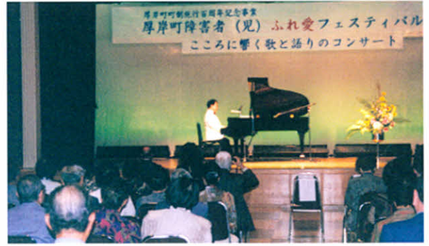
H12.9.30 厚岸町障害者(児)ふれあいフェスティバル