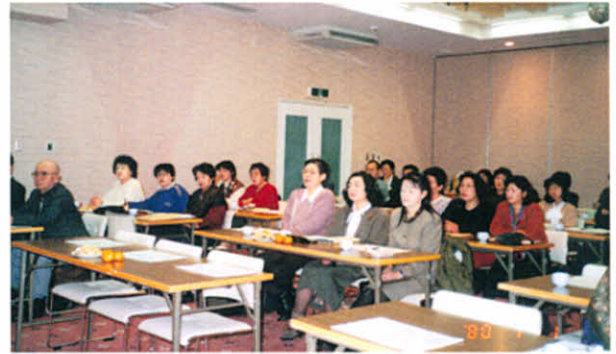
H4.2.25～26 道東ブロック支部役員研修会（ホテル金万）