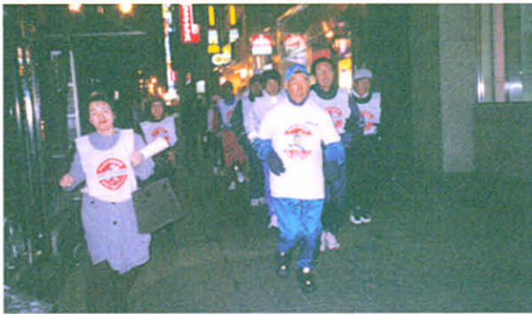
H11.11.29 日本一周マラソン・ゴールイン出迎え(札幌市)