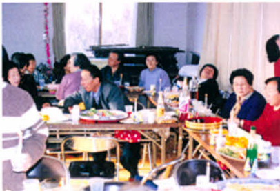
H7.12.11 クリスマス交流会(筑紫恋公民館)