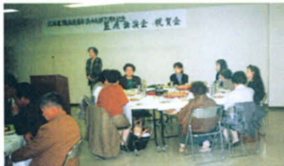
懐かしく、楽しい交流会