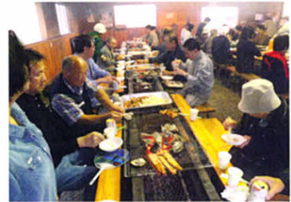
レクリエーションで汗を流した後は、バーベキューで舌鼓(合同レクリエーション)