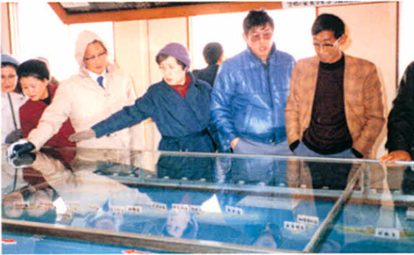
北方領土って、つくづく近くて遠い所ですね