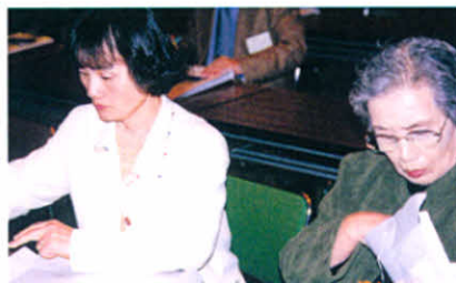
研究会に出席の支部長と事務局長