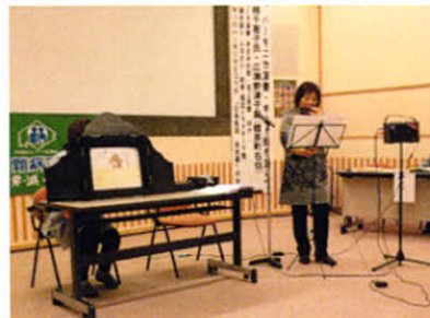
アトラクション～ハーモニカの音色と童心に帰り紙芝居(医療講演会)