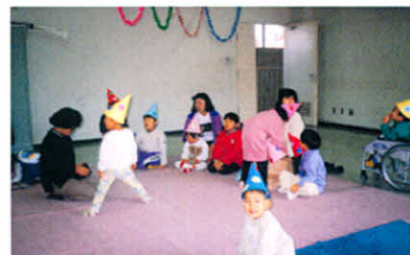
みんなサンタの帽子可愛い