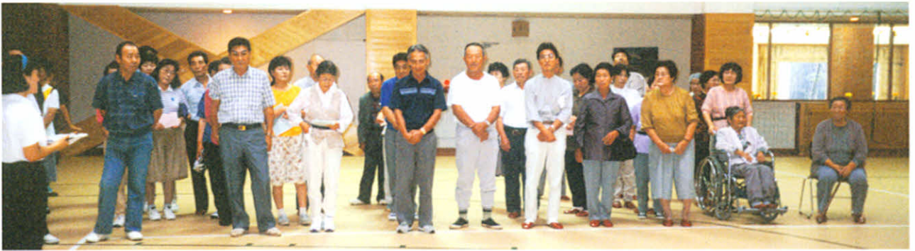
H6.9.17 合同レクリエーション開会式(厚岸少年自然の家)