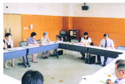
H19.8.23 難病医療福祉相談会打ち合わせ (保健福祉総合センター)