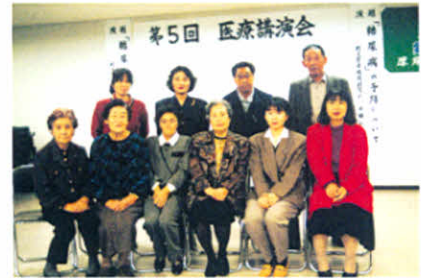
H9.11.15 医療講演「糖尿病の予防について」