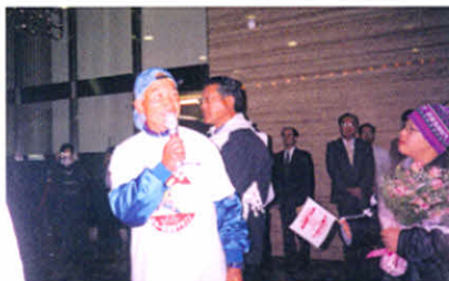
沢本さんの完走後のインタビュー