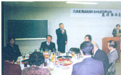
H4.11.28 支部設立15周年記念講演会・祝賀会（社会福祉センター）