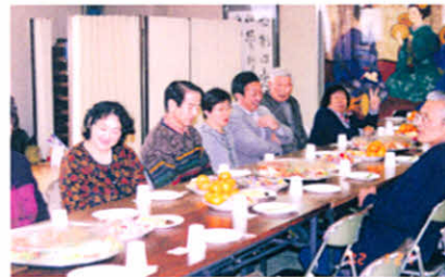
交流しながら美味しく