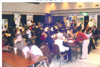
ふれあいフェスティバル会場内