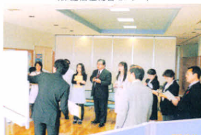
H19.10.14 事前打ち合わせ (保健福祉総合センター)