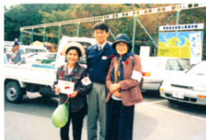
H9.10.5 赤い羽根街頭募金(子野日公園)