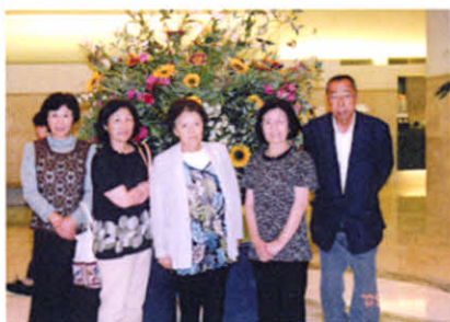
標茶・弟子屈支部と一緒(全道集会)