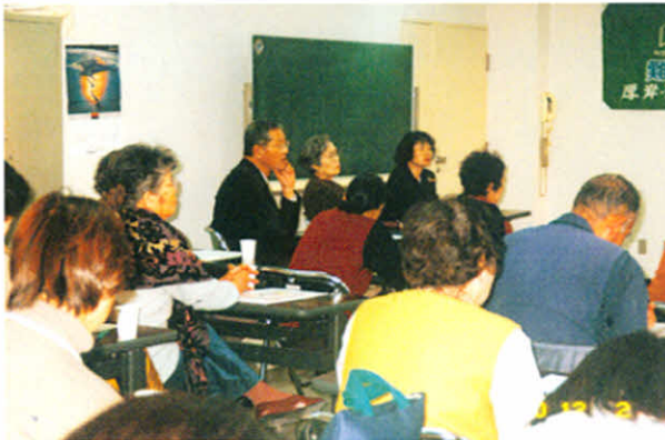
「医療講演」 みなさん、真剣です