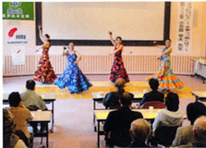
講演会前に本格的なフラメンコダンサーの踊りでリラックス(医療講演会)