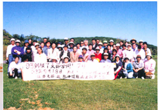
みんなにっこり「ハイチーズ」