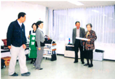
皆さん御苦勞様でした(医療講演会)