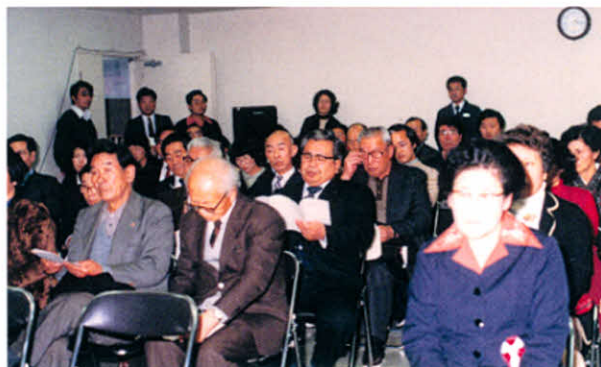
S56.12.5 沢山の参加者に大変盛り上がりました