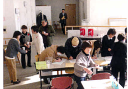
国会請願署名にも協力依頼(医療講演会)