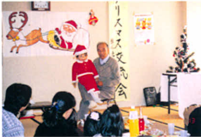
H9.12.13 クリスマス交流会(社会福祉センター)