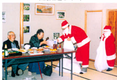
H8.12.15 サンタさん、プレゼントありがとう!!