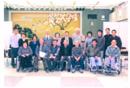
H17.1.16 厚障連新年会(社会福祉センター)