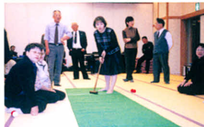
スカットボールで楽しみました!(役員研修会)