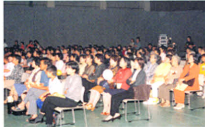
シャンテ公演、摩周文化交流センターにて