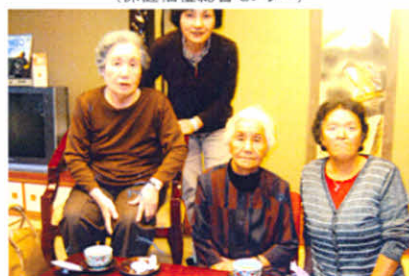
H19.10.20～21 身障分会合同研修旅行 (弟子屈町川湯)