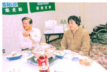
H19.2.24～25 道東地区支部役員研修会 (ホテル五味)