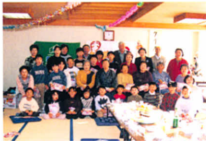
皆んなおすまし、ハイポーズ!!