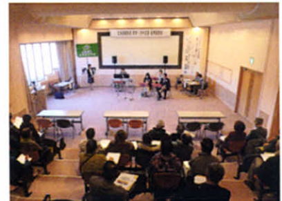
講演前にアンサンブルの音色で癒し(医療講演会)