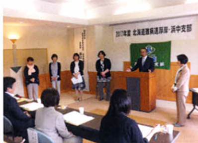
初めての浜中町で開催した支部総会での役員挨拶(支部総会)