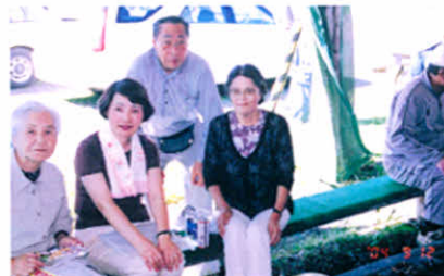
H16.9.12 釧根地区合同レクリエーション(音別町)