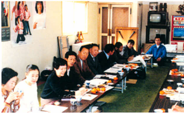
道東6支部合同研修会のようす

1・14 難病センター設立10周年記念祝賀会(札幌市) 3・2 難病連役員研修会(札幌市) 2名参加 3・5~6 地区役員研修会(阿寒町雄岳荘、営林署保養所) 3名参加