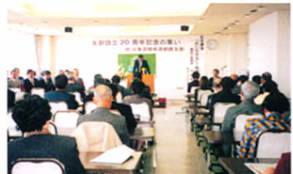
H11.11.6 釧路支部設立20周年(釧路市)