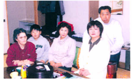
お部屋に集合して楽しいおしゃべり