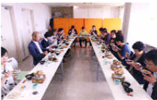
同じ釜の飯で深い交流！ （支部総会交流会）