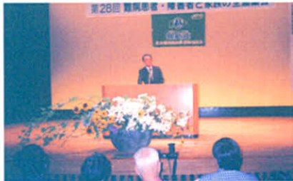
H13.8.4~5 第28回全道集会(札幌市)