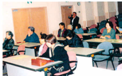
熱心に聞いてます