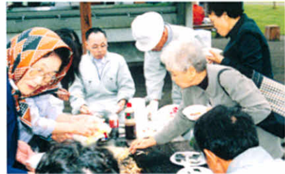
H13.9.16 釧根地区支部合同レクリエーション(別海町)