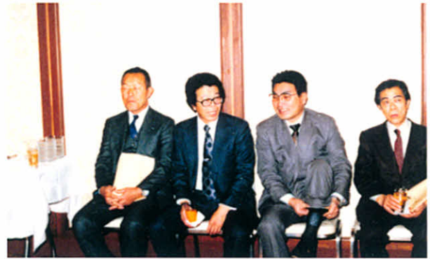
S58.1.14 北海道難病センター開設・道難連結成10周年財団法人設立記念祝賀会(札幌市.プリンスホテル)