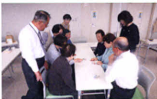
知恵を出し合って、間違い探しにチャレンジ(支部交流会)