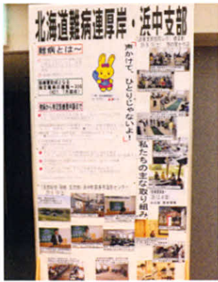
ポスターセッションで支部活動紹介(ふれあいフェスティバル)