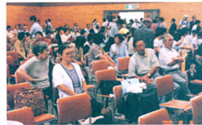
休けいで一息中です