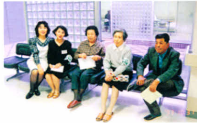
浜中診療所のロビーにて