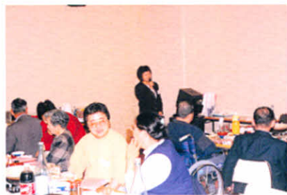
道東地区支部役員研修会