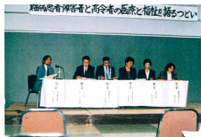
パネラーの皆さま