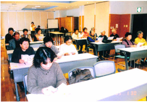
H17.1.30 生活習慣病のアドバイスとレクリエーション(保健福祉総合センター)