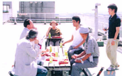
H17.8.27~28 厚障連研修旅行(鹿追町)