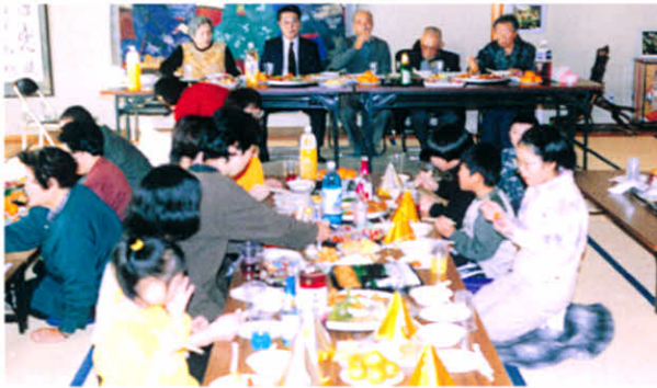
H6.12.10 第1回クリスマス交流会(社会福祉センター)