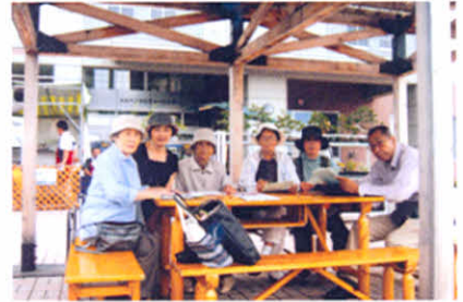
H20.7.13 支部役員会（女満別町）