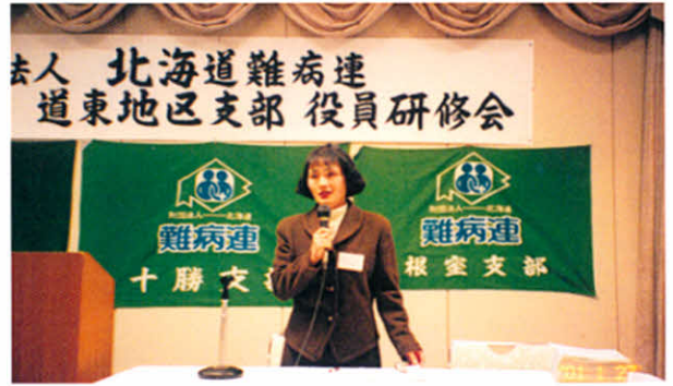
H13.1.27~28 道東地区支部役員研修会(幕別町)