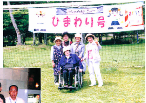
H17.7.7 「走れ! ひまわり号」運行ボランティア(厚岸少年自然の家)