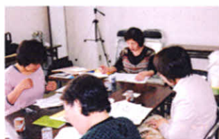
紺野支部長、共に頑張りましょう(支部役員会)