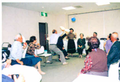
身障分会合同研修旅行でレクリエーションに夢中