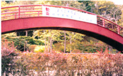
H11.9.19 「走れ! ひまわり号」(子野日公園)